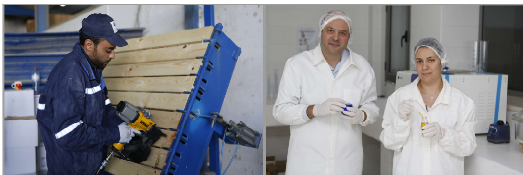
Photo à gauche : employé de l'entreprise COMAF, une société fondatrice du consortium Tunisia Building Partner (TBP).

Grâce à ce soutien, les entreprises pourront également mieux faire face aux conséquences de la crise du COVID19. Toutes ces mesures ont été conçues en fonction des besoins des entreprises et visent l'ensemble de l'Afrique subsaharienne. Le projet s'adresse aux PME et vise à soutenir les entreprises dirigées par des femmes, qui sont sous-représentées et peu actives dans le domaine de l'exportation.