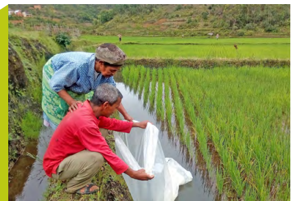
Reisbäuerinnen und -bauern besetzen ihre Felder mit Fischen

Herausgeber Bundesministerium für wirtschaftliche Zusammenarbeit und Entwicklung (BMZ) Referat 110