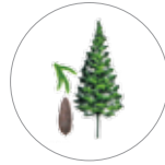
Oyamel ( Abies religiosa )