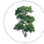
Pino de las alturas ( Pinus hartwegii )

Los ecosistemas principales son bosques de pino, de oyamel, pino encino y pastizales alpinos.