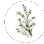
Enebro azul ( Juniperus monticola )