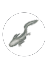
Ajolote de arroyo ( Ambystoma leorae )

Estas dos ANP albergan una gran diversidad de especies.