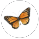
Mariposa Monarca ( Danaus plexippus )