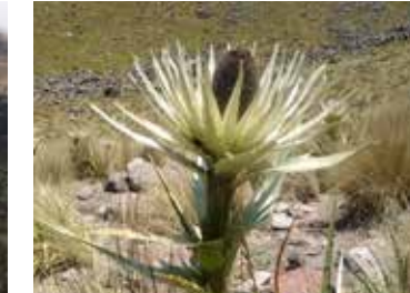
Conservación de la biodiversidad