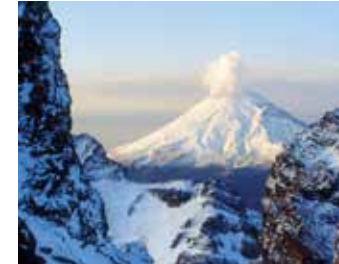
Captación e infiltración de agua

Estas dos Áreas Naturales Protegidas ofrecen grandes beneficios para la región más poblada del país.