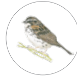
Gorrion Serrano ( Xenospiza baileyi )