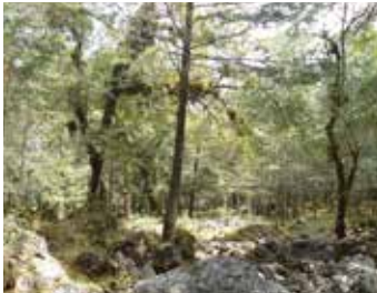
Captura de carbono

Los ecosistemas principales son bosques de pino, de oyamel, pino encino y pastizales alpinos.