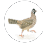
Gallina de monte coluda ( Dendrortyx macroura )