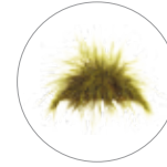
Zacatón ( Festuca toluensis )