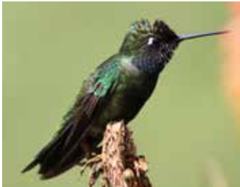
Hábitat de especies