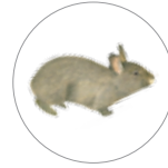
Teporingo o zacatuche ( Romerolagus diazi )