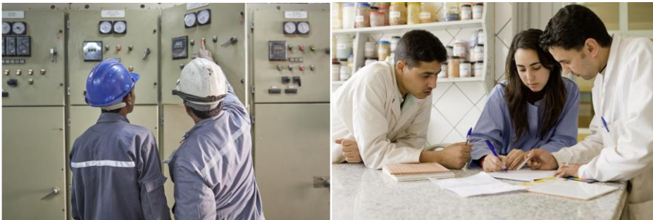
الصورة اليسرى: تشجيع التكوين بالتناوب

يهدف مشروع "AEDA" إلى دعم وزارة التكوين والتعليم المهنيين وكذا بعض الجامعات من خلال التعاون مع وزارة التعليم العالي والبحث العلمي، بغية تحسين فرص خريجي المعاهد المهنية والجامعات في التوظيف في مجالات مستهدفة، متعلقة بكفاءة الطاقة والقدرة على تسييرها والطاقات المتجددة.