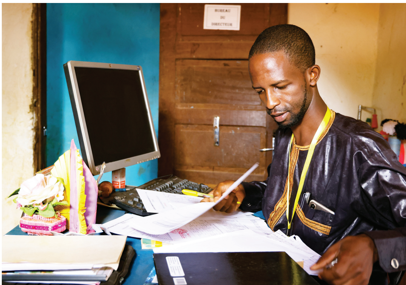
La comptabilité de l'atelier couture à Meiganga