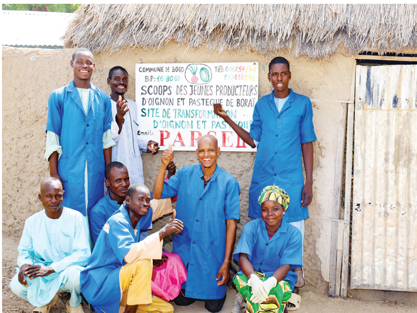
L'Entreprise ayant accueilli des stagiaires

L'amélioration de l'employabilité des apprenants repose sur une meilleure prise en compte de l'environnement économique et sur des interconnexions avec le milieu socioprofessionnel afin de bâtir des compétences adaptées à l'exercice du métier et aux besoins du marché.