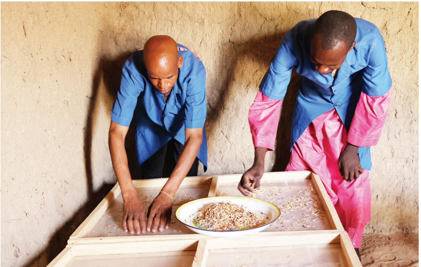
Stagiaire en apprentissage du séchage d'oignon dans le SCOOPS des jeunes producteurs de Borai (Commune de Bogo, Extreme-Nord)

d'autres entreprises de la place. Le déplacement des apprenants vers les sites de stages ainsi que leur retour étaient assurés par les entreprises d'accueil si le site de stage est distant de leur domicile. Sur les sites de stages, les horaires de travail sont de 8h 00 à 16h00 tous les jours ouvrables.