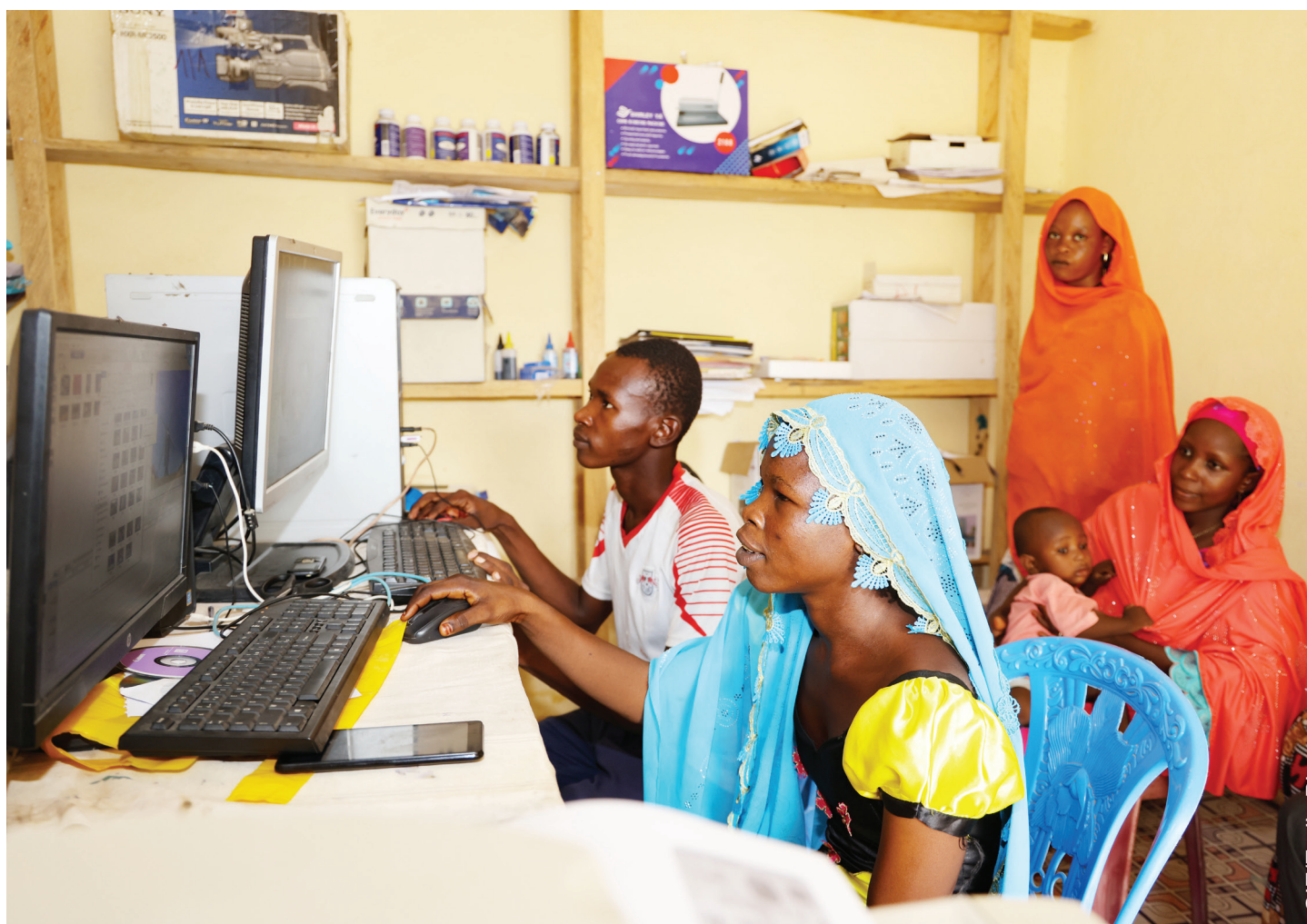
Le secrétariat bureautique ACHABAKA Infos dans la commune de Mora à l'Extreme-Nord (Téléchargement des musiques, traitement d'image etc.)

La méthodologie globale adoptée tout au long de la mission se décline de la manière suivante : d'abord réaliser une étude de faisabilité pour évaluer les potentialités et les contraintes, la culture numérique des jeunes, les conditionnalités de la réussite de la mission, ensuite former des jeunes sélectionnés et enfin faire le suivi individuel lequel a été couronné par un atelier de restitution.