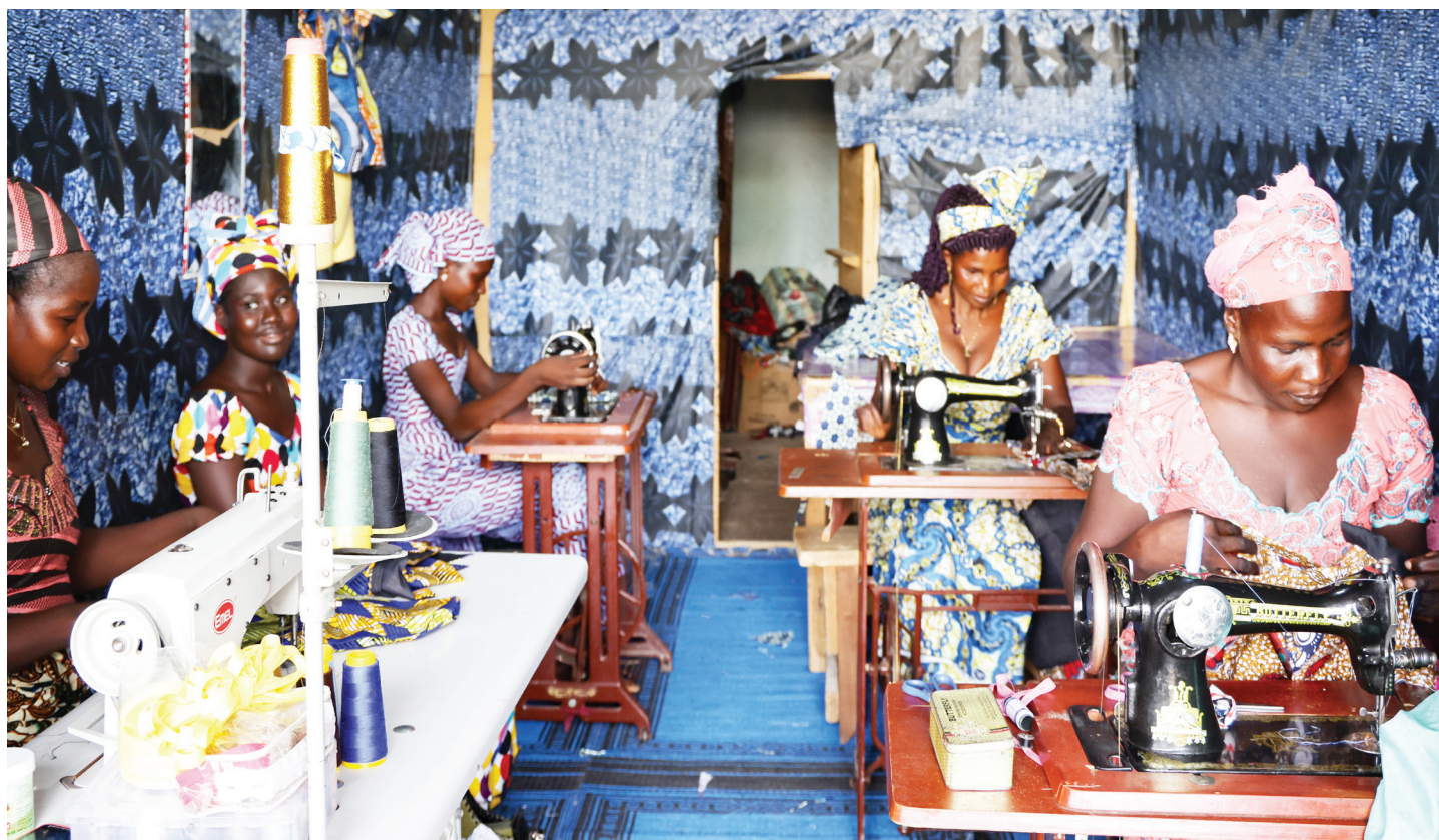
Atelier de couture GIC femme et filles de Yagoua ayant accueilli des stagiaires