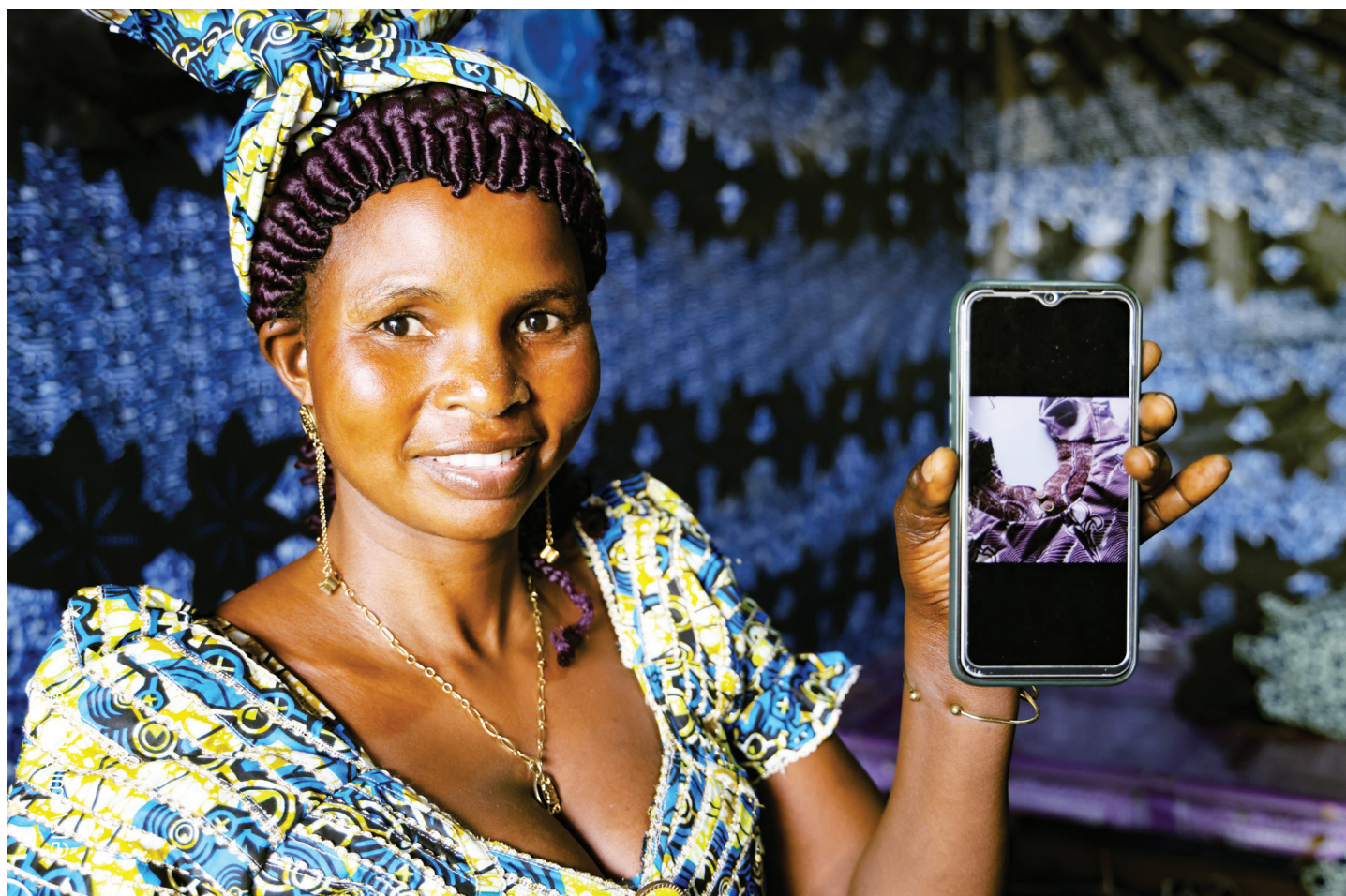
La presidente de l'atelier couture GIC femme et fille de Yagoua met à la disposition de ses clientes les modèles à reproduire sur son whatsapp personnel

Systematiser l'évaluation des stagiaires par les entreprises et par les formateurs.