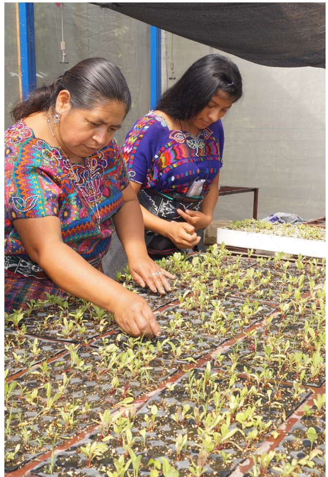
Promotoras Dirección Municipal de la Mujer - San Miguel Chicaj

Finalmente, el proyecto promueve el enfoque de género, a partir del fortaleciendo de mujeres vulnerables en su capacidad de organizarse y articularse para participar e incidir en la toma de decisiones en igualdad de condición a nivel local, en asuntos relacionados con gestión ambiental y en los gremios de cadenas de valor.