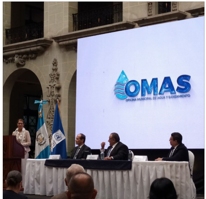
Celebración del día mundial del agua 2023