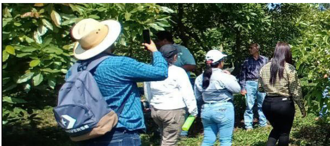
Trabajo de campo

Lluvias por encima del promedio, canículas amplias, deslaves y erosiones que ponen en peligro cosechas, infraestructura y comunidades enteras, presentan solo algunos de los eventos extremos y consecuencias que tiene que afrontar la población guatemalteca. En particular, los ecosistemas naturales y la población rural de escasos recursos sufren de altos niveles de vulnerabilidad y afectación, debido a que uno de sus principales medios de vida es la agricultura. Las tierras de una familia rural tienen un área promedio menor de 0.5 hectáreas, aportando entre el 75-80 % del abastecimiento básico de alimentos del país. Sin embargo, como consecuencia del cambio climático (CC) se incrementa el riesgo de bajos rendimientos y pérdidas en la producción agrícola, así como en todo el sector productivo, por lo tanto, amenaza la seguridad alimentaria nacional. El uso de medidas para reducir riesgos climáticos sigue siendo bajo y la gran parte del área rural del país no está lo suficientemente adaptada para enfrentar las consecuencias. Asimismo, con respecto al desarrollo del territorio, el uso de los recursos naturales no se hace de forma sostenible ya que son sobreexplotados y hay una tala inmoderada de áreas forestales, lo cual afecta los ecosistemas naturales. Finalmente, como consecuencia de los aspectos mencionados, la disponibilidad del recurso hídrico es limitada y la vida de la población rural es afectada de una manera directa.