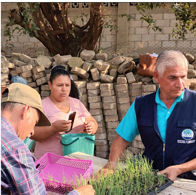
Entrega de pilones a productores por MAGA y GIZ