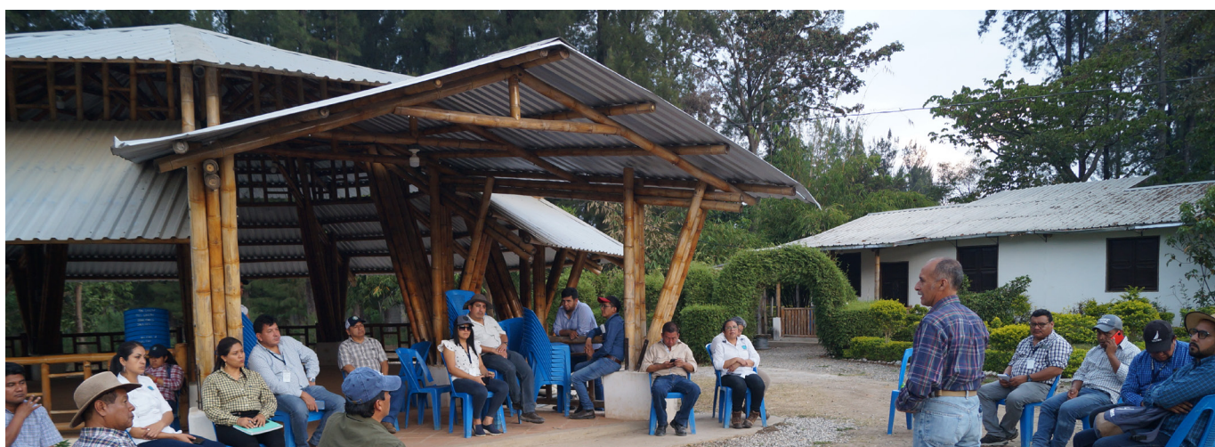
Centro de Adaptación al Cambio Climático - San Miguel Chicaj

3. Coordinación con la Dirección de Coordinación y Extensión Rural del MAGA. Permite capacitar técnicamente sobre la adaptación y el uso de las MACC. En total, más que 2000 técnicos, educadores, productores y promotores extensionistas fueron beneficiados, impactando entre 10 a 35 familias campesinas quienes se forman sobre buenas prácticas y tecnologías agrícolas para la producción sostenible. Actualmente, en el último semestre y con el objetivo de fortalecer la seguridad alimentaria, se facilitó la implementación de 1500 huertos familiares que contribuyen al consumo familiar, en particular en tiempos de crisis.