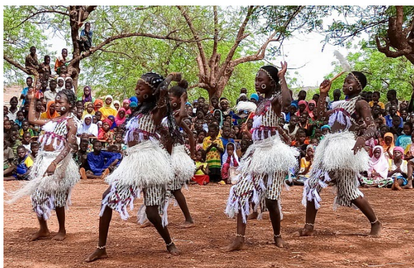
Ballet d'élèves hôtes et PDI lors d'activités socio-éducatives

Relèvement économique : promotion de la relance économique auprès des populations déplacées et hôtes vulnérables sur l'axe OKDD dans le cadre d'un cofinancement avec l'UE et exécuté en consortium avec Enabel. Le PDICA accompagne la formation professionnelle des PDI et des populations hôtes. Il appuie les populations vulnérables dans la création et la promotion d'activités génératrices de revenus. Les acteurs locaux étatiques et non étatiques bénéficient d'un renforcement de capacités en gouvernance économique locale pour un accompagnement adéquat au secteur privé de la région.