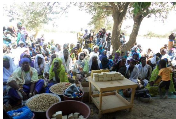
Des femmes en pleine activité génératrice de revenus