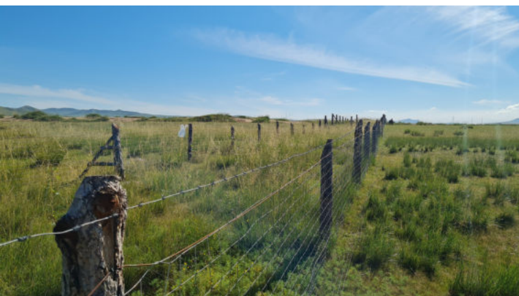
Жавхлант сум дахь туршилтын талбай: 2023 оны 8-р сарын 24

Сэлэнгэ, Хэнтий аймгийн зургаан сумдад байгуулсан ойн тогтвортой менежмент (ОТМ)-ийн туршилт, судалгааны талбай нь ойн аж ахуйн зарим арга хэмжээг загвар байдлаар хэрэгжүүлж, олонд таниулах зорилготой юм. Энэхүү арга хэмжээнүүд нь ойн эрүүл мэнд, тогтвортой байдлыг сайжруулахын зэрэгцээ ойн эдийн засгийн үр өгөөжийг нэмэгдүүлэхэд чиглэнэ. Үүнээс гадна мод, бут, сөөгний тооллого, ургамалан бүрхэвчийн үнэлгээ, шавжийн тооллого, хөрсний төлөв байдлын судалгаа, задралын түвшин, мөнх цэвдгийн гүнийг тодорхойлох зэрэг ажиглалт, мониторинг хийж байна.