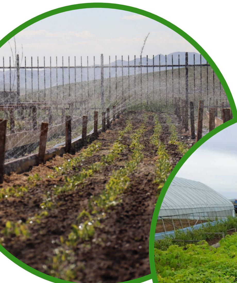
Мод үржүүлгийн газар: 2023 оны 6-р сарын 7

Мод үржүүлгийн газарт тус бүр 3 далан агч, хайлаас, тус бүр 1 далан шар хуайс, бүйлс, гүйлс зэрэг нийт 16,000 ширхэг модыг ургуулж байна. Үүнээс гадна мод үржүүлгийн үйл ажиллагааны хамгийн чухал хэсэг болох усалгаа, хогийн ургамлыг түүх ажлуудыг сумын ЗДТГ, иргэдийг оролцоотойгоор тогтмол хийж, үржүүлгийн талбайн хэвийн ажиллагааг хангаж байна.