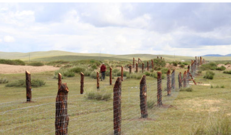
Жавхлант сум дахь туршилтын талбай (хашаалсны дараа): 2022 оны 8-р сарын 21