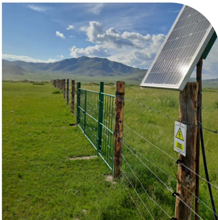
Агро-ойн загвар талбай: цахилгаан хашаа барихын өмнөх ба дараах байдал