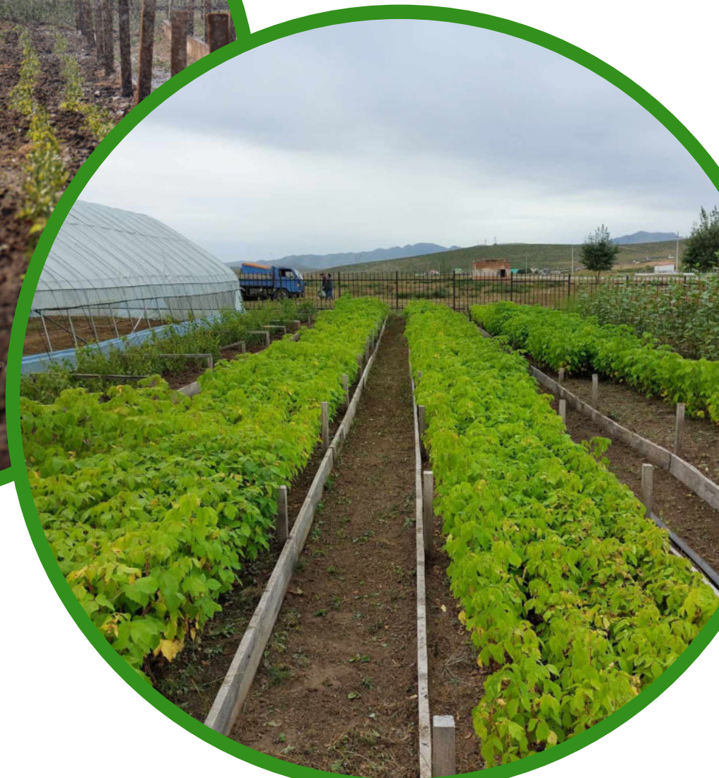
Мод үржүүлгийн газар: 2023 оны 9-р сарын 13