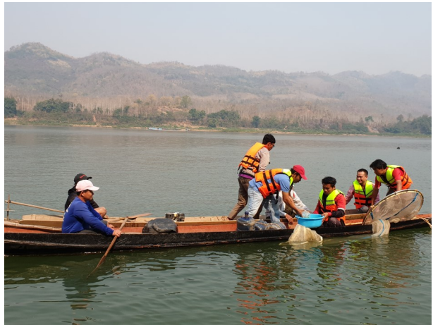
ຜູ້ເຂົ້າຮ່ວມຝັກອົບຮົມ ວຽກງານປະມົງຂອງ ໂຄງການ ຮ່ວມກັນຕິດຕາມສິ່ງແວດລ້ອມ ຂອງແມ່ນໍ້າຂອງ. ເດືອນ ກຸມພາ, ທີ່ແຂວງຫລວງພະບາງ, ສປປ ລາວ