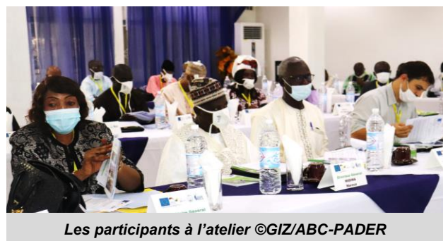
Les participants à l'atelier

A l'issue des échanges en groupe, quelques recommandations clés ont été dégagées notamment la nécessité de mettre en cohérence toutes les initiatives pour un maximum d'efficacité, clarifier le lien entre la SODECOTON et le Bureau d'étude GFA et d'inclure les délégations régionales de MINEFOP et MINPROFF parmi les ministères sectoriels pour la mise en œuvre du programme. De même, il a été recommandé d'ajouter CCA-BANK, SAVANNAH et le réseau des MUFID dans la liste des institutions impliquées dans l'activité en lien avec les EMF/IMF.