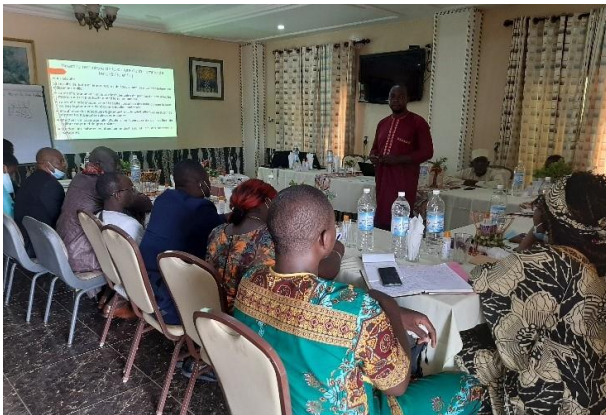
Séance de travail

Plus de 45 agents de crédit tirés des Etablissements des Microfinance partenaires ont participé aux journées thématiques organisées par le projet ProFinA dans les régions du Centre, Ouest et Adamaoua.