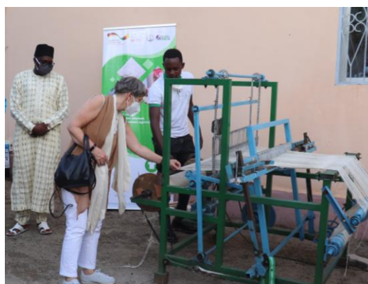
Machine à tisser