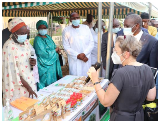
Visite du stand anacarde