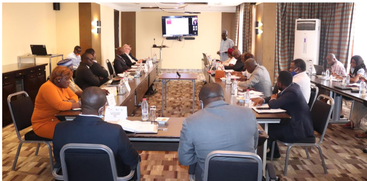
Vue d'ensemble des participants à l'atelier

C'était au cours d'un atelier de deux jours organisés par le Projet Financement Agricole (ProFinA) à l'hôtel Hilton de Yaoundé. L'objectif de la séance était de créer un lien entre les investisseurs internationaux et les EMFs en vue de mobiliser des ressources financières adaptées pour le financement agricole au Cameroun.