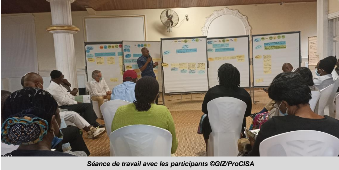
Séance de travail avec les participants

Plus de 30 acteurs clés de la chaîne de valeur pomme de terre se sont réunis à Bafoussam du 24 au 26 août 2021 pour constituer les bases d'une plateforme fonctionnelle qui permettra de transformer le sous-secteur de cette filière. La cérémonie a été présidée par le Délégué Régional du MINADER Ouest, Metenou Paul.