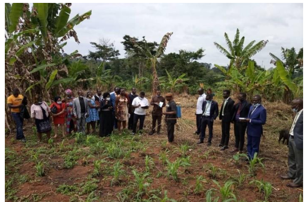
Descente sur le terrain

Les JoT sont mensuelles et se tiennent dans les trois régions opérationnelles du Projet : Adamaoua, Centre et Ouest. Au cours d'une demi-journée, les agents de crédits échangent sur les bonnes pratiques relatives au financement agricole ; discutent sur une CVA afin de trouver les outils et méthodes pour un meilleur financement ; partagent les défis dans le financement des CVA ; identifient les maillons à forte valeur ajoutée ainsi que les acteurs et enfin, font une descente au sein d'une exploitation agricole.