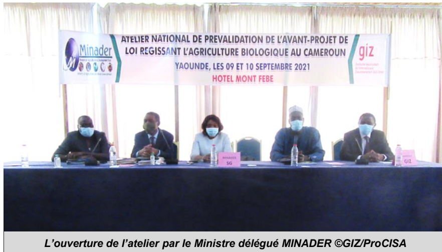
L'ouverture de l'atelier par le Ministre délégué MINADER

Plus de cinquante acteurs du sous-secteur de l'Agriculture biologique se sont retrouvés du 09 au 10 septembre à l'Hôtel Mont Febe pour amender et adopter l'avant-projet de loi régissant l'Agriculture biologique