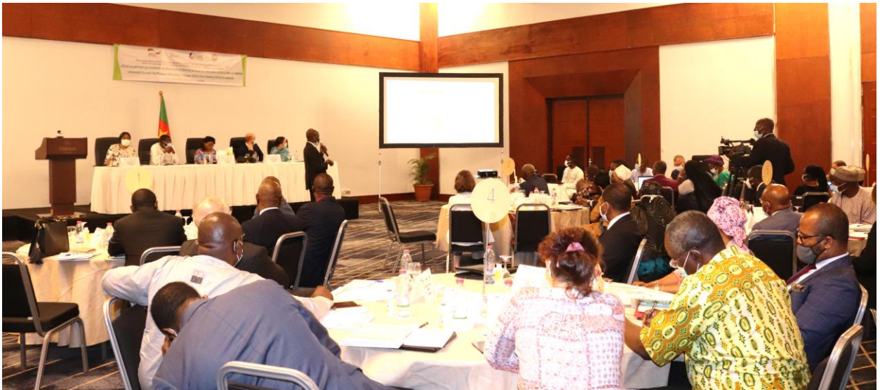
Vue d'ensemble des participants à l'atelier

Le Ministre Délégué au Ministère de l'Agriculture et du Développement Rural (MINADER) Mme Clémentine Ananga, a présidé un atelier de deux jours du 05 au 06 octobre à Yaoundé pour le lancement du processus de développement d'une Stratégie Nationale pour le Financement Agricole (SNFA).